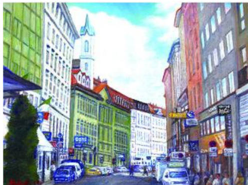
「ウィーンの街並み」(P12) 古小路 浩典（日本）